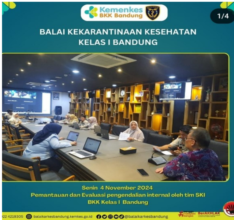
Rapat Reviu Pemantauan dan Evaluasi Pengendalian Internal, November 2024 serta Partisipasi Aktif Pimpinan Satker dalam Mensupport Peran SKI di BKK Kelas I Bandung