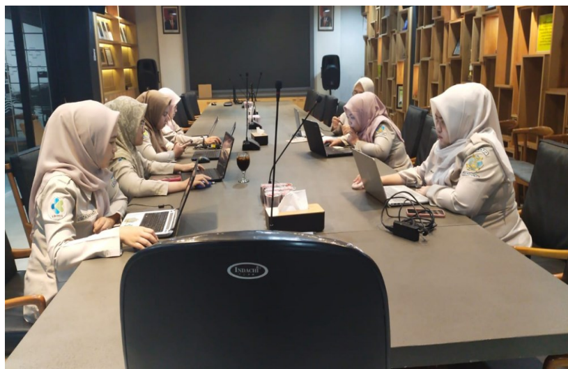
Rapat Reviu Laporan Keuangan Semester I – Tahun 2024