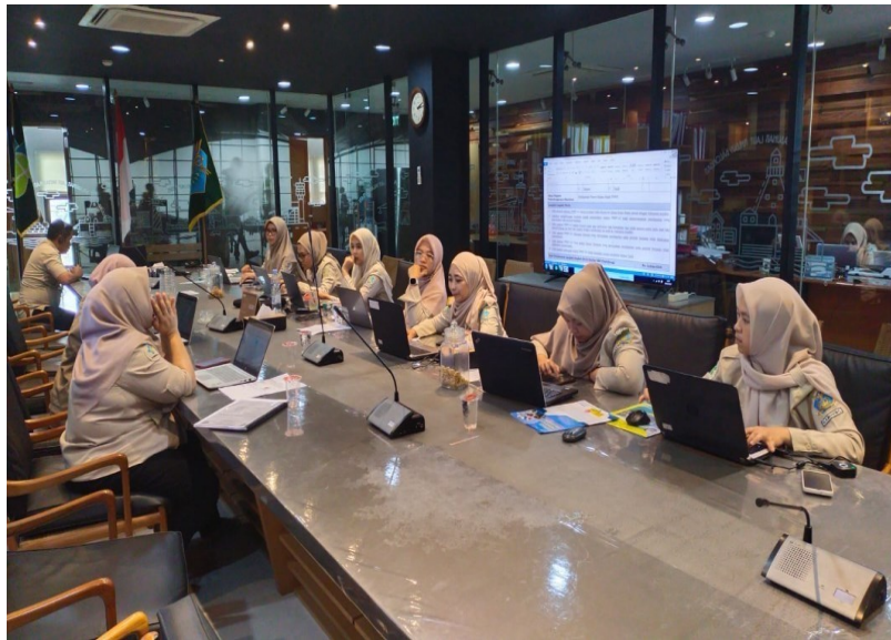
Rapat Reviu Tim SKI terhadap Laporan Keuangan Triwulan I – Maret 2024