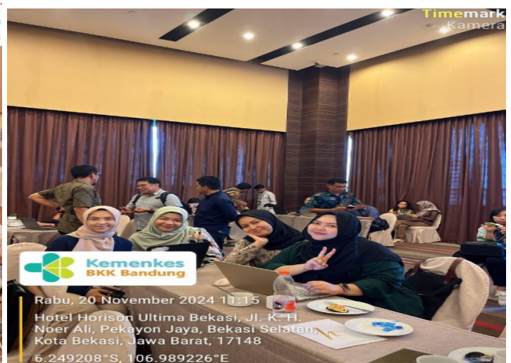
Pendampingan Tim SKI KKP Bandung saat kegiatan Desk PIPK di Tingkat Pusat