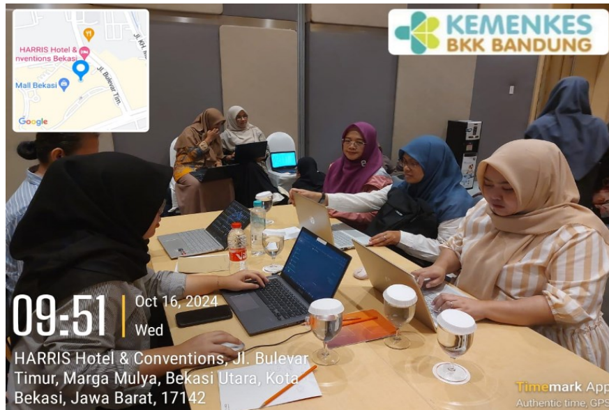
Pendampingan SKI saat Kegiatan desk Laporan Keuangan dan BMN di tingkat pusat