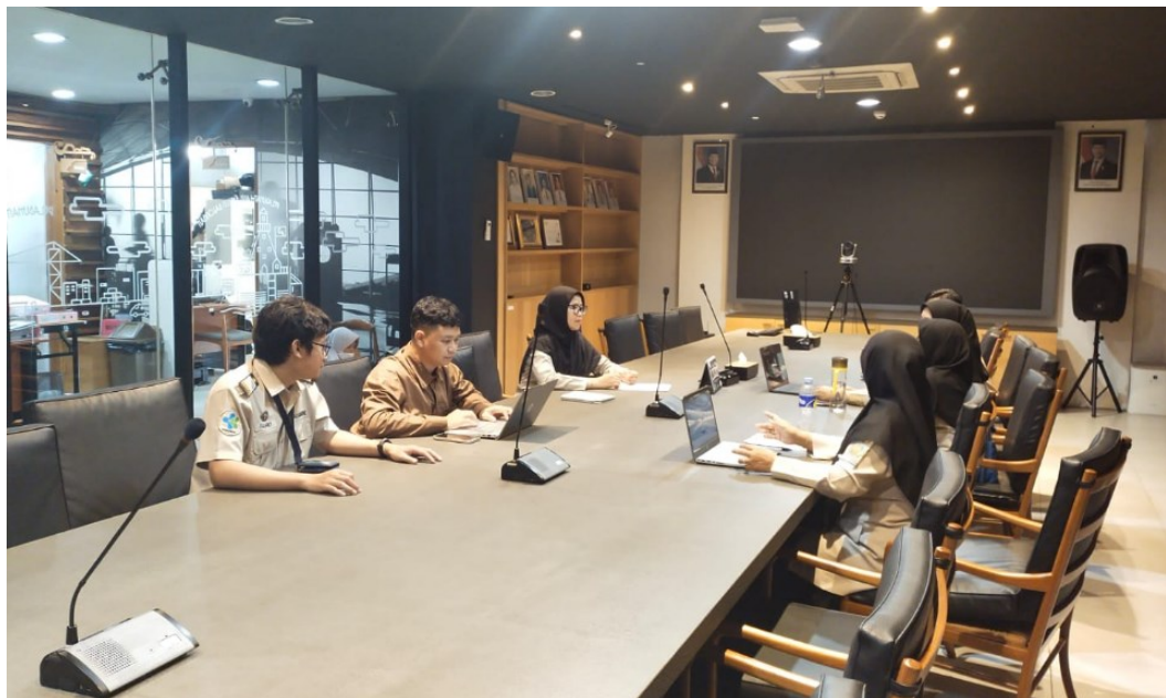
Rapat Review Perencanaan oleh Tim SKI KKP Bandung