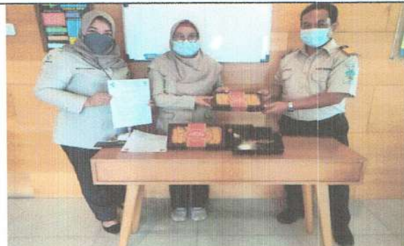
Public Campaign di tempat pelayanan asrama haji Bekasi, sosialisasi tentang Gratifikasi dan serah terima gratifikasi kepada Yayasan yatim piatu

Demikian laporan UPG telah dibuat sebagaimana mestinya untuk dapat memperoleh masukan dan menunjang pelaksanaan kegiatan UPG di tahun yang akan datang